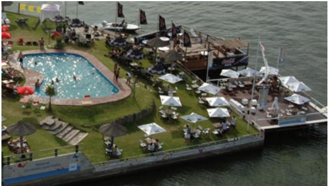
PARADOR LAS ROSAS CARLOS PAZ