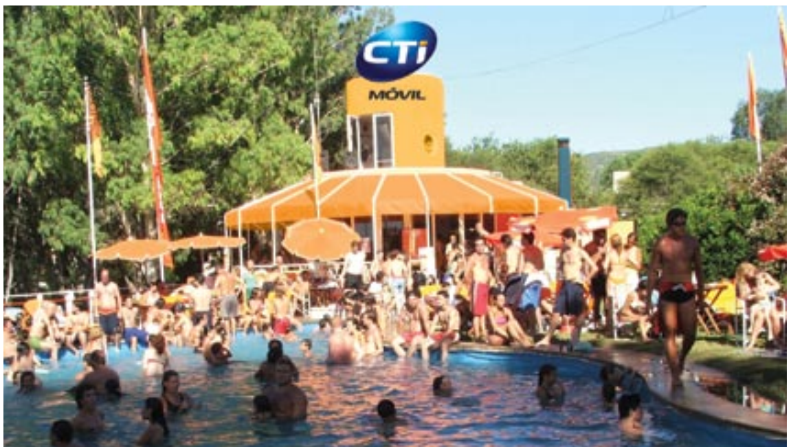
PARADOR AMARRAS CARLOS PAZ