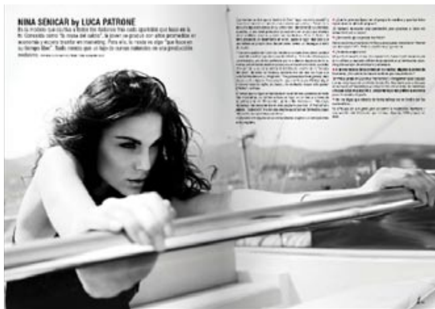
PROFILE: una nota para conocer en profundidad a la modelo que ilustra nuestra tapa: sus gustos, su historia, sus sueños y esos pequeños detalles que la hacen tan particular.