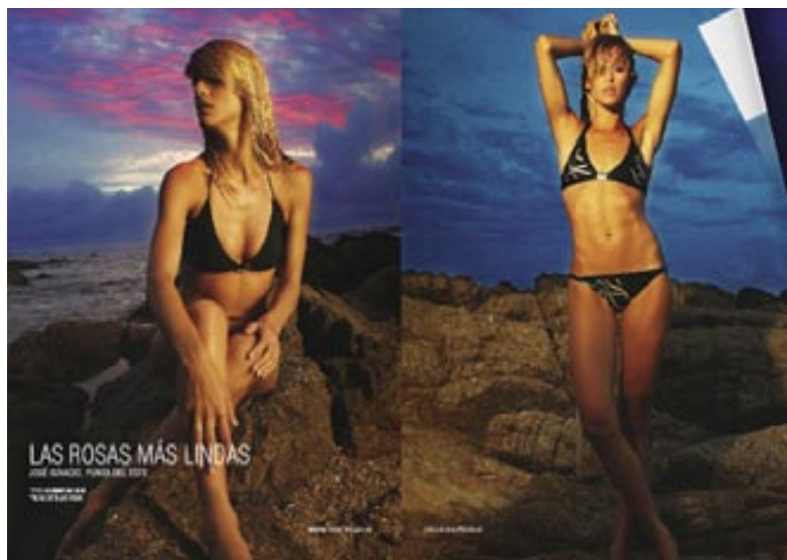
LAS ROSAS MÁS LINDAS: una de nuestras secciones estrella, iluminada por la belleza de las chicas y la alta calidad artística que caracteriza a las producciones.